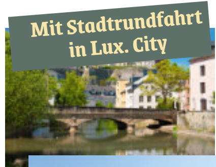
Mit Stadtrundfahrt in Lux. City

Frühstück „Graf Johannes“ Erlebnistour ins Großherzogtum Luxemburg , Stadt Luxemburg, Ardennen, Luxemburger Schweiz . Die Fahrt führt in den deutsch-luxemburgischen Nationalpark nach Echternach . Möglichkeit zum Besuch der Willibrord Basilika, römische Kastell u.v.m. Weiterfahrt durch die Luxemburgische Schweiz mit sehenswerten Felspartien und Tälern, durch das Müllertal zur Stadt Luxemburg. Stadtrundfahrt zu den Sehenswürdigkeiten wie Großherzogliches Palais, Europabrücke, Festungsanlage, Kathedrale u.a. Am Nachmittag Zeit zur freien Verfügung. Rückfahrt 16.00 Uhr. Gegen 18.30 Uhr Abendessen nach Winzerart: moselländischer Grillschinken mit Kräwes (Vegetarische Alternative möglich, bitte bei Buchung angeben), dazu ein Digestiv und Wein soviel wie jeder mag (bis 24.00 Uhr). – Übernachtung