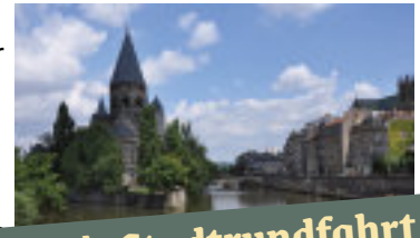
Mit Stadtrundfahrt in Metz