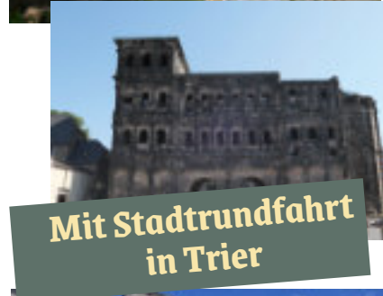
Mit Stadtrundfahrt in Trier

Frühstück „Graf Johannes“ (Mit dem eigenen PKW): Fahrt zur historischen Altstadt von Berncastel . Lernen Sie hier während einer einstündigen Schiffrundfahrt (nicht im Preis enthalten) die einzigartige Landschaft der Mittelmosel von ihrer schönsten Seite kennen. Anschließend Zeit zur freien Verfügung, Gelegenheit für eine Fahrt mit dem Burg-Landshutexpress oder zur Besichtigung des Cusanusstiftes. (ALTERNATIVE Ausflugsfahrt nach Cochem und Beilstein, entlang der Terrassenmosel nach Koblenz mit Deutschem Eck und Gelegenheit für eine Fahrt mit der Seilbahn zur Festung Ehrenbreitstein.) Gegen 18.30 Uhr Abendessen. Riesling-Lorbeer-Hack mit Rotkohl und Salzkartoffeln. Anschließend Weinprobe mit fachlicher Erläuterung und Nachverkostung. Gelegenheit zum Weineinkauf. Alle Getränke frei bis 24.00 Uhr. – Übernachtung