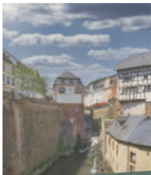
INKL. FAHR M.D. SAARTALBAHN UND SAAR-SCHIFFFAHRT!